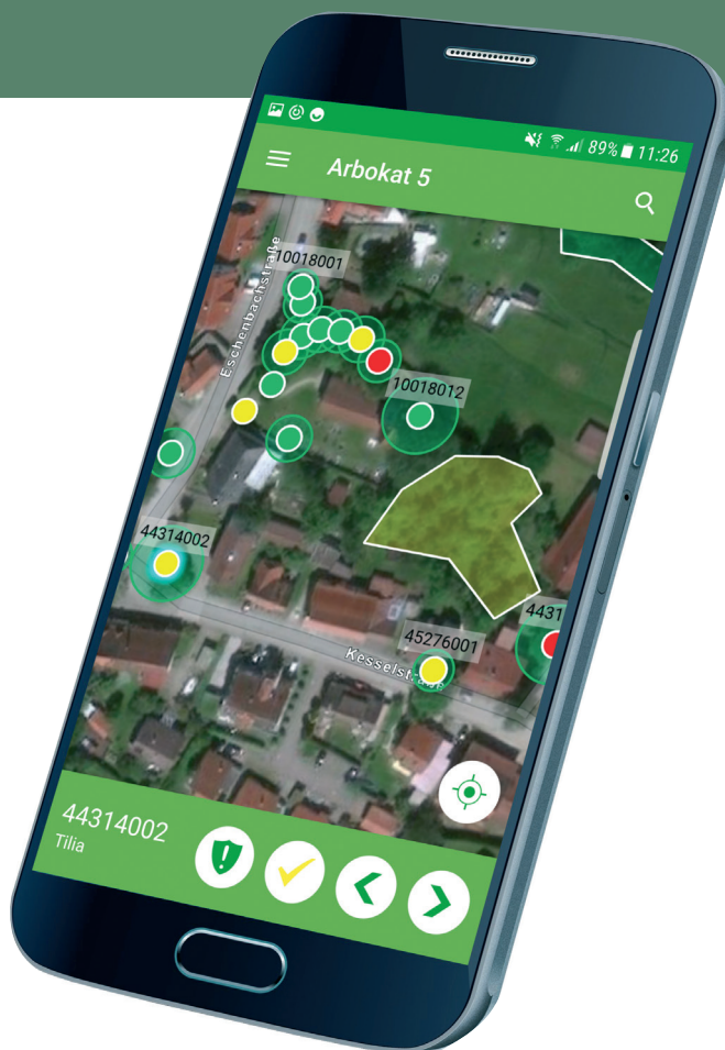
Arbokat® App: Baumkontrolle schnell und unkompliziert

Als Kartengrundlage nutzt die Arbokat® App hochwertige Hintergrundkarten aus ArcGIS Online (Luftbilder und Straßendaten). Die Bereitstellung von Geodaten für den Außendienst ist nicht notwendig.